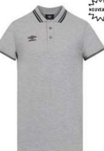
GRIS CHINÉ 12